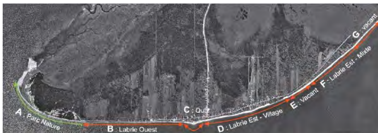
FIGURE 1 : LOCALISATION DU PROJET DE STABILISATION (MUNICIPALITÉ DE POINTE-AUX-OUTARDES, JUIN 2016)

Il est à souligner qu'en cours d'analyse de la recevabilité, la Municipalité de Pointe-aux-Outardes a effectué une demande de soustraction à la procédure d'évaluation et d'examen des impacts sur l'environnement en vertu de l'article 31.6 de la Loi sur la qualité de l'environnement. La Municipalité de Pointe-aux-Outardes désirait stabiliser temporairement une section de la berge du côté ouest du quai municipal le plus rapidement possible afin de prévenir les dommages qui pourraient être causés par d'éventuelles tempêtes lors de l'hiver 2017. L'objectif principal de cette stabilisation temporaire était d'assurer la sécurité des usagers de la rue Labrie et d'éviter l'isolement des résidences dans le cas de l'effondrement de la rue. Le décret numéro 1106-2016 du 21 décembre 2016 a été pris en ce sens. Il autorisait le remplissage des zones effondrées avec du matériel granulaire afin de maintenir le matériel composant actuellement la berge en place. Suite à ce décret, deux certificats d'autorisation ont été délivrés afin d'effectuer des travaux vis-à-vis les adresses civiques numéro 87, 97 et 101 de la rue Labrie.